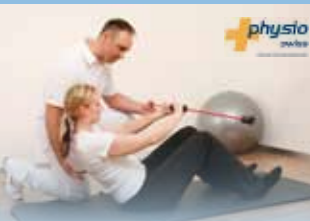
ESP - Sporttherapie - Sportreha®