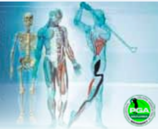
Certified by European Golf Association®